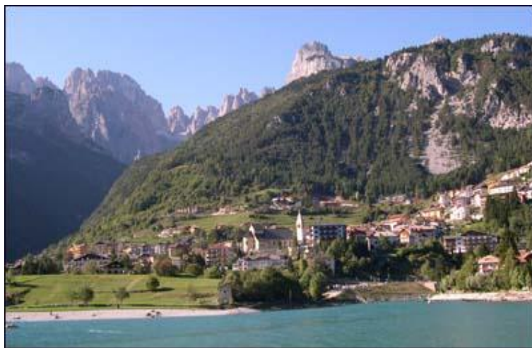
Molveno (il lago)